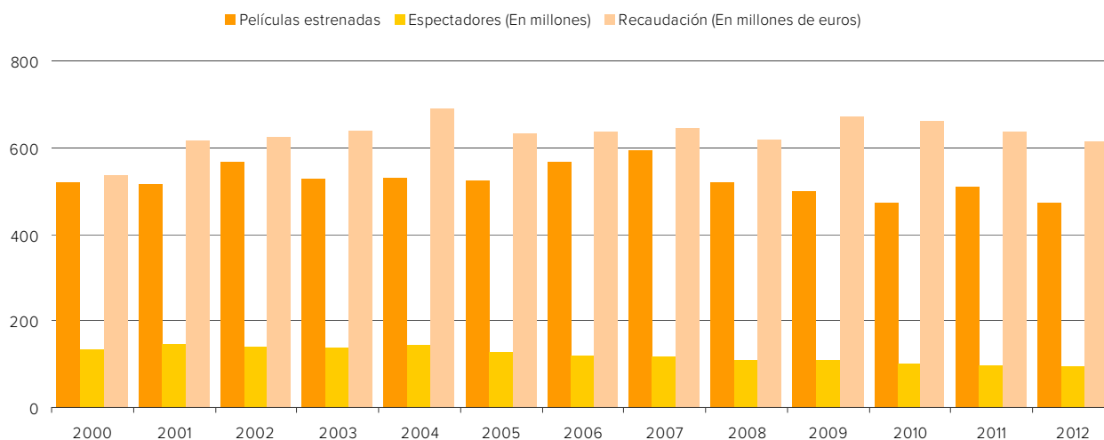
Gráfico 16.3. Películas estrenadas, espectadores y recaudación (Valores absolutos)